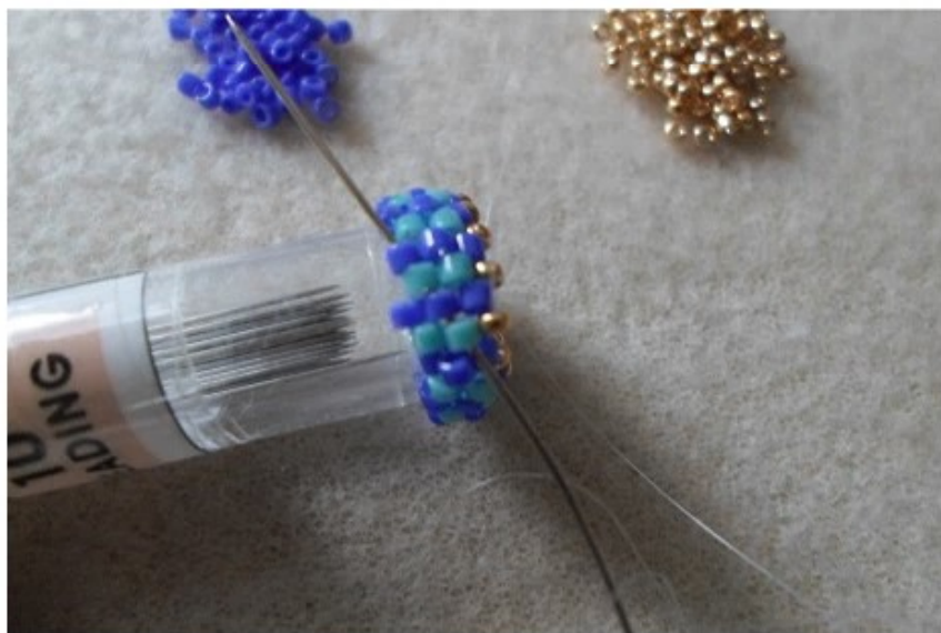
6. át a másik oldalra