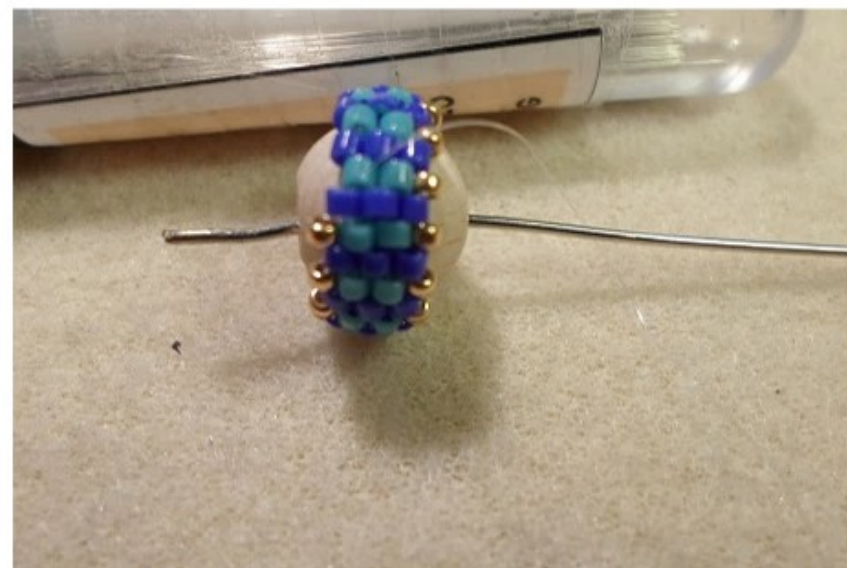
7. 15/o kása 14 db