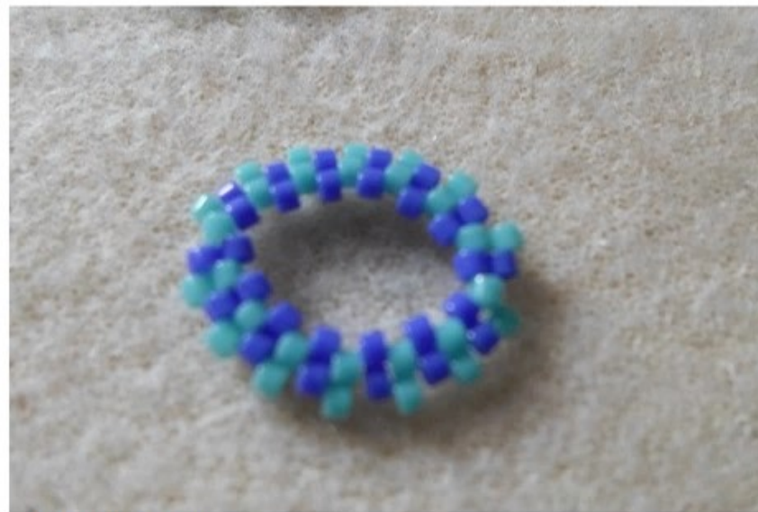
3. delica B 14 db