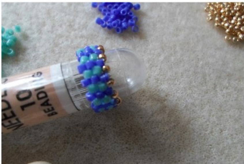
5. 15/o kása 14 db