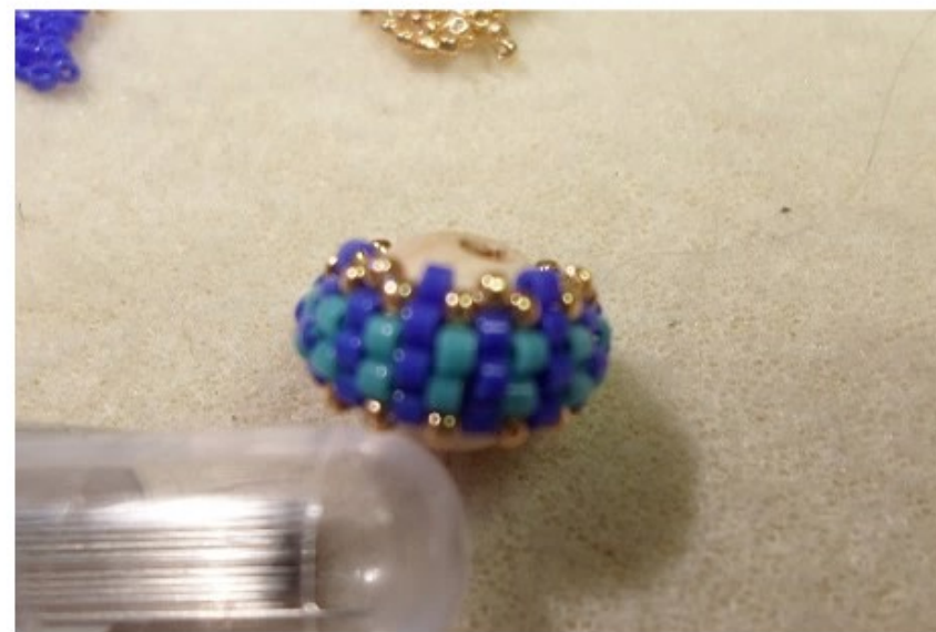
8. 1 db delica A, 1 db 15/o kása, (7-7 db)