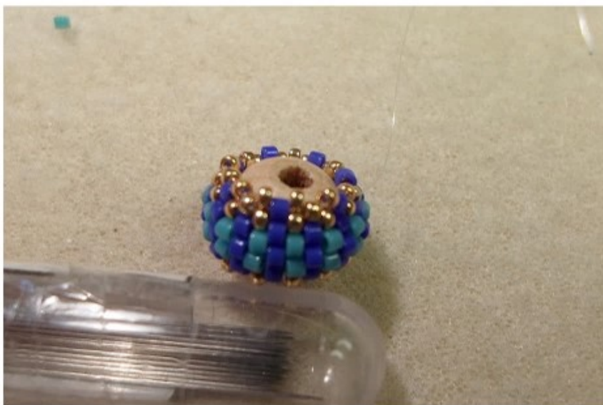
9. 15/o kása 14 db