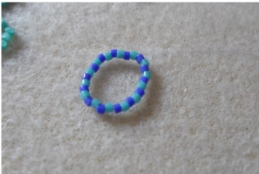
1. 28 db delica A és B szín felváltva, alkoss kört